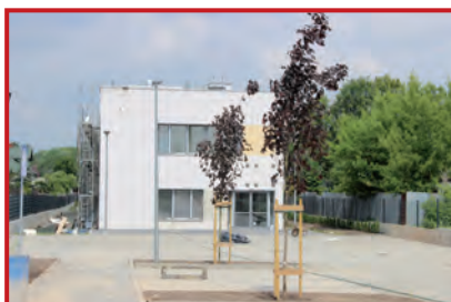
Wokół przedszkola wyrosły drzewa