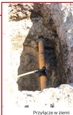
Przyłącze w ziemi