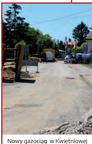
Nowy gazociąg w Kwietniowej

Należy dodać, że urząd gminy Raszyn uzyskał dofinansowanie od Wojewody Mazowieckiego Zdzisława Sipiery w wysokości 1 924 420 zł w ramach programu: Rozwój gminnej i powiatowej infrastruktury drogowej na lata 2016 – 2019, które przekroczy połowę kosztów przebudowy tej ulicy.