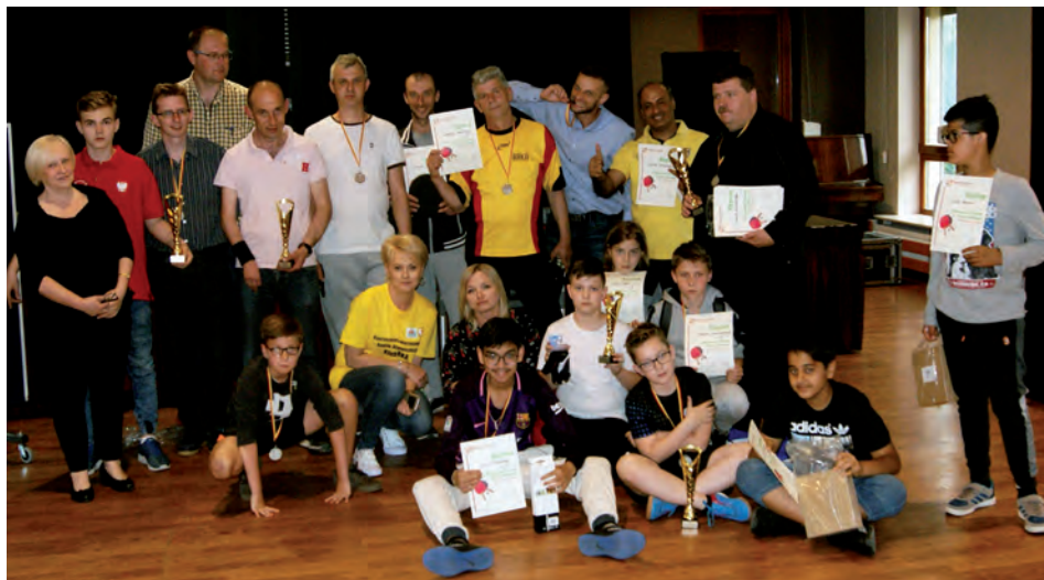
Uczestnicy Wiosennego Turnieju

SPRAWOZDANIE Z PIKNIKU W RYBIU W NASTĘPNYM NUMERZE KURIERA.