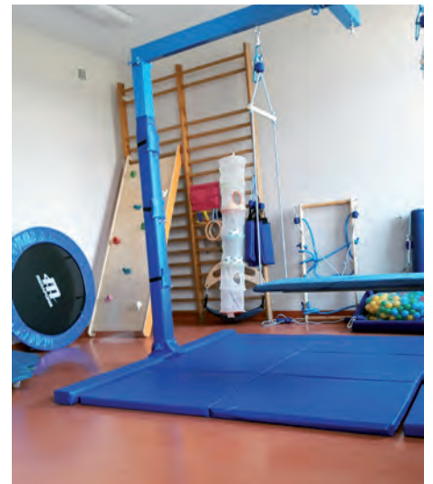
Wyposażenie sali SI

Osoba przeprowadzająca badania, a następnie terapię, jest wykwalifikowanym Terapeutą Integracji Sensorycznej. Podczas terapii dziecko jest zachęcane i kierowane do wykonywania aktywności, które wyzwalają i prowokują odpowiednie, skuteczne reakcje na bodźce sensoryczne. W trakcie zajęć wykonywane są odpowiednie dla dziecka aktywności dostarczające stymulacji przedsionkowej, proprioceptywnej, dotykowej, słuchowej, wzrokowej i węchowej. Stopień trudności tych aktywności stopniowo wzrasta tak, aby wymagać od dziecka bardziej zorganizowanych i zaawansowanych reakcji. W trakcie terapii preferowane są ukierunkowane zabawy i aktywności swobodnie wykonywane przez dzieci, wyzwalające automatyczne