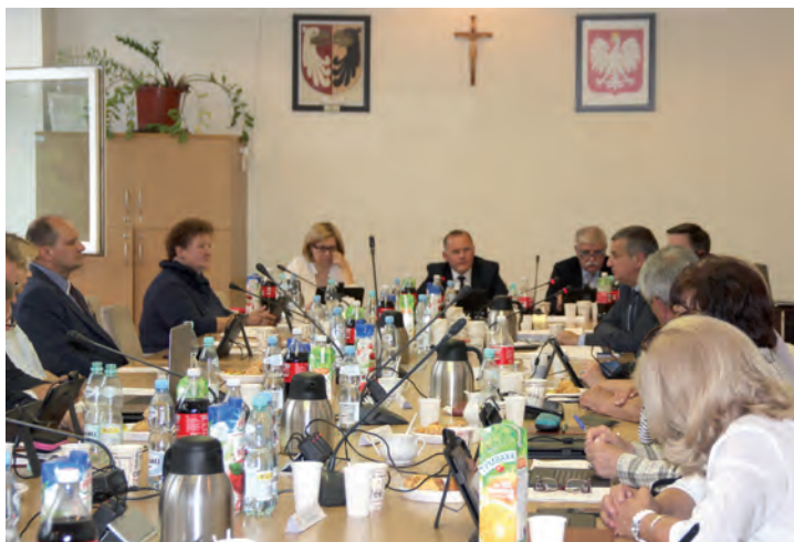
LIII Sesja rady Gminy Raszyn