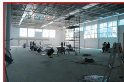
Hala sportowa etap malowanie