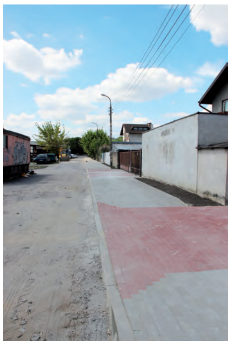
Ścieżka rowerowa na Nadrzecznej