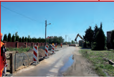
Kanalizowanie ul Wygody