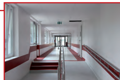
Przedszkole wypucowane i zamknięte

Prace w przedszkolu zakończono. Całość łni czystością, świeżymi tapetami, nieskazitelnymi podłogami, glazurami i terakotami w łazienkach. Na dachu skompletowano urządzenia wentylacyjne. Korytarze zamknięto dla ciekawskich. Obiekt oczekuje odbioru i dzieci.