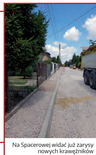
Na Spacerowej widać już zarysy nowych krawężników

Ulica Spacerowa rozkopana na całej długości. Robotnicy zerwali nawierzchnię, wyjęli stare krawężniki i przebudowali kanalizację deszczową. Nie ulega wątpliwości, że przebudowa ulicy Spacerowej jeszcze potrwa, ponieważ Gmina Raszyn przyjęła za zasadę, że każda tego typu inwestycja musi mieć charakter kompleksowy od instalacji podziemnych poczynając, a na nawierzchni i oświetleniu kończąc. Choć trwa trochę dłużej i kosztuje więcej, to w dłuższym okresie przynosi znaczne korzyści. Ulica będzie tak piękna, że mieszkańcy pewnie szybko zapomną o chwilowych niedogodnościach.