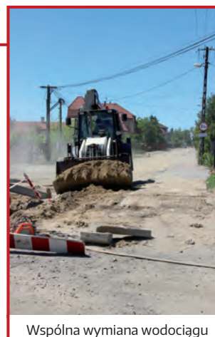
Wspólna wymiana wodociągu