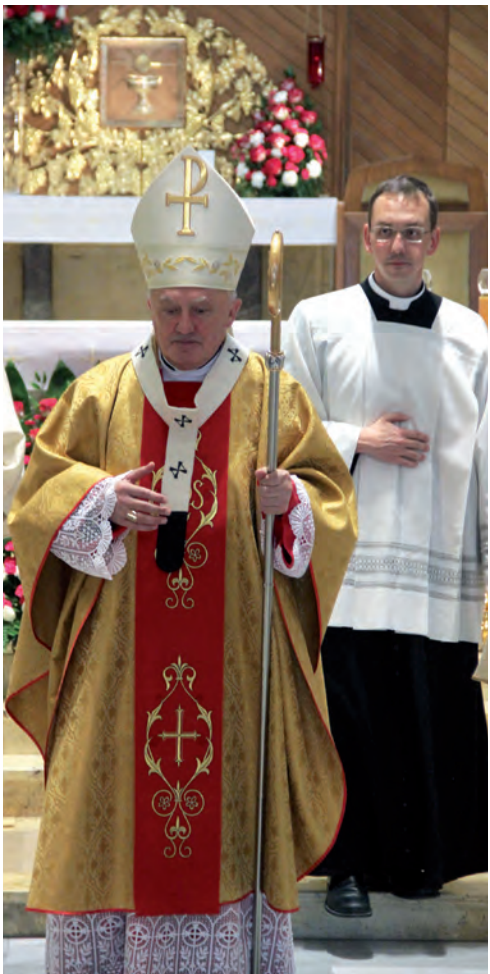
Kardynał Nycz