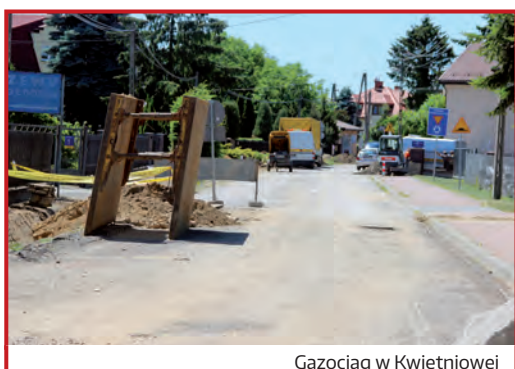
Gazociąg w Kwietniowej