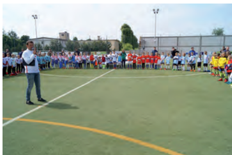
Zaczynamy rozgrywki