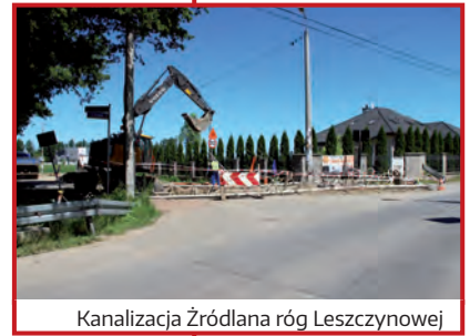
Kanalizacja Źródlanej róg Leszczynowej