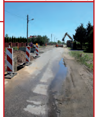
Kanalizacja ul Wygody