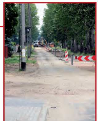
Kanalizacja na Olszynowej