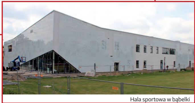
Hala sportowa w bąbelki