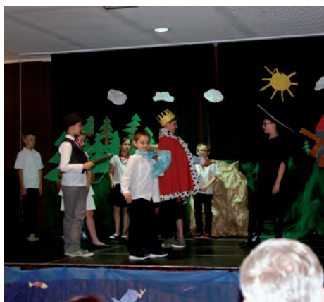
Kot w butach © R. Król

Z okazji Dnia Mamy i Taty dzieci ze Świetlicy przygotowały, pod czujnym okiem wychowawczyń, inscenizację bajki „Kot w butach”. Dzieci rzetelnie przygotowały się do występu, ponieważ bajka była skomplikowana. Młodzi artyści wywiązali się doskonale ze swojego zadania, czego wyrazem były rześiste oklaski od mamusi i tatusiów. Na zakończenie wręczyły rodzicom własnoręcznie zrobione prezenty, po czym wszyscy udali się na okolicznościowy poczęstunek.