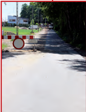
Kanalizacja na Źródlanej

Dobiega końca budowa sieci kanalizacji sanitarnej w Laszczkach w ramach projektu pn. Uporządkowanie gospodarki wodno-ściekowej w Gminie Raszyn – faza V z podziałem na zadania. Prace koncentrują się u zbiegu ulic Źródlanej i Leszczynowej w Laszczkach. Budowniczym, czyli firmom BKW Bogdan Tarnowski z Nasutowa wraz z Przedsiębiorstwem Robót Inżynieryjnych Energo-pol z Lublina pozostało do ułożenia, jak twierdzą, kilka metrów rurociągu, wyposażenie przepompowni i naprawienie jezdni. W tym miesiącu koniec? Zobaczmy.