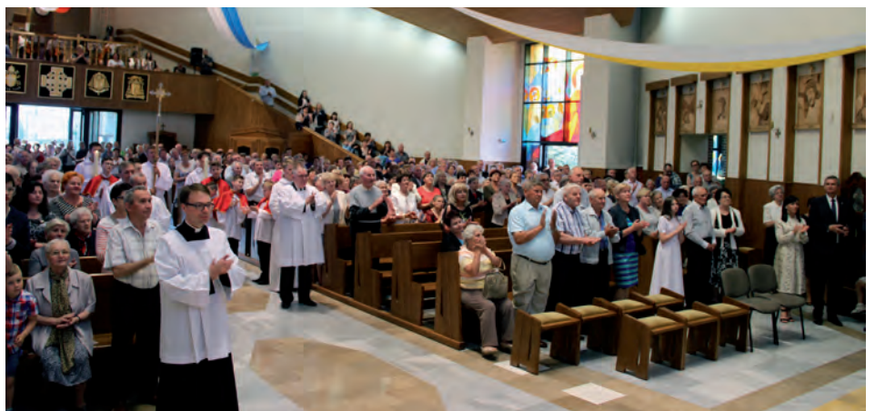
Msza św. Dziękczynna w kościele w Rybiu