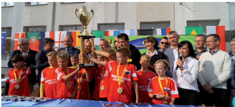
Zwycięska drużyna