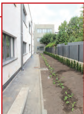
Chodniki i uprawy

Największe zmiany widać w otoczeniu starej szkoły i w nowych budynków. Do pracy przystąpili brukarze i ogrodnicy. Księżycowy krajobraz, który towarzyszył inwestycji od początku znika, a w jego miejsce pojawiają się bruki, grządki i drzewa.