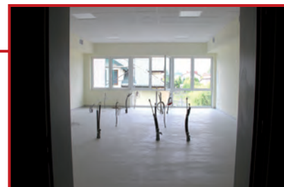
Tu będzie pracownia