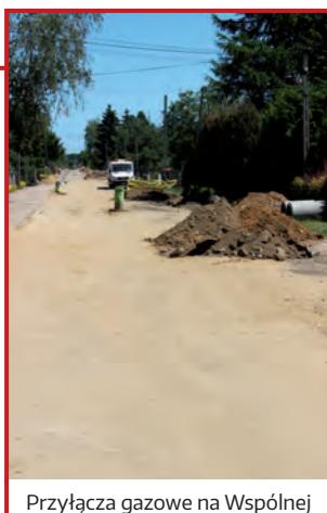
Przyłącza gazowe na Wspólnej