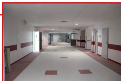
Nowa szkoła prawie gotowa