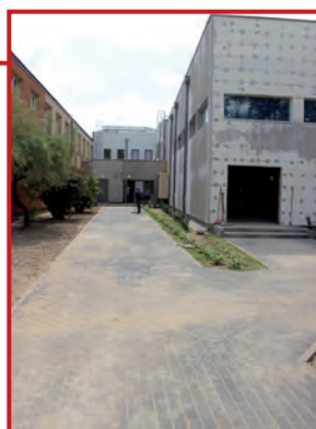
Chodniki od strony auli