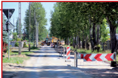
Olszynowa od strony ronda