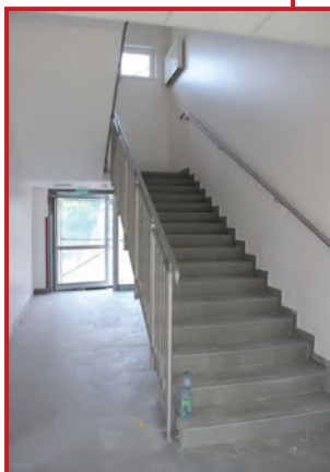
Klatka schodowa jest gotowa

W szkole ostatnie porządki. Wszystkie prace wykonano, a informacje o nich publikowaliśmy poprzednio. Teraz dokonywane są poprawki po malowaniu, czyszczone kontakty, futryny, myte okna. W przyszłej bibliotece zgromadzono meble.