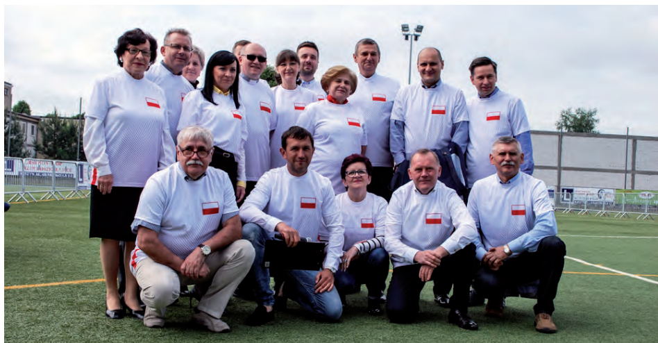
Drużyna Raszyńskiego Samorządu