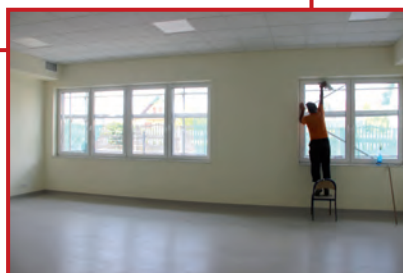
Pozostało mycie okien