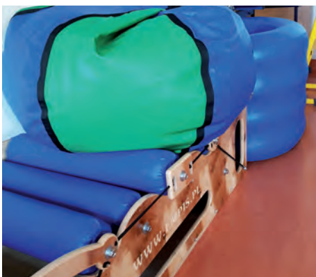
Pomoce w sali SI, fot. arch. szkoły

Wiele osób nie zdaje sobie sprawy z istnienia układów sensorycznych: dotykowego, przedsionkowego, proprioceptywnego, słuchowego, wzrokowego i węchowego. Nie tylko powinny one funkcjonować prawidłowo, ale także ze sobą współpracować. W przeciwnym razie dziecko doświadcza kłopotów dotyczących interakcji z otoczeniem, a także rozpoznawania sygnałów wysyłanych przez własny organizm.