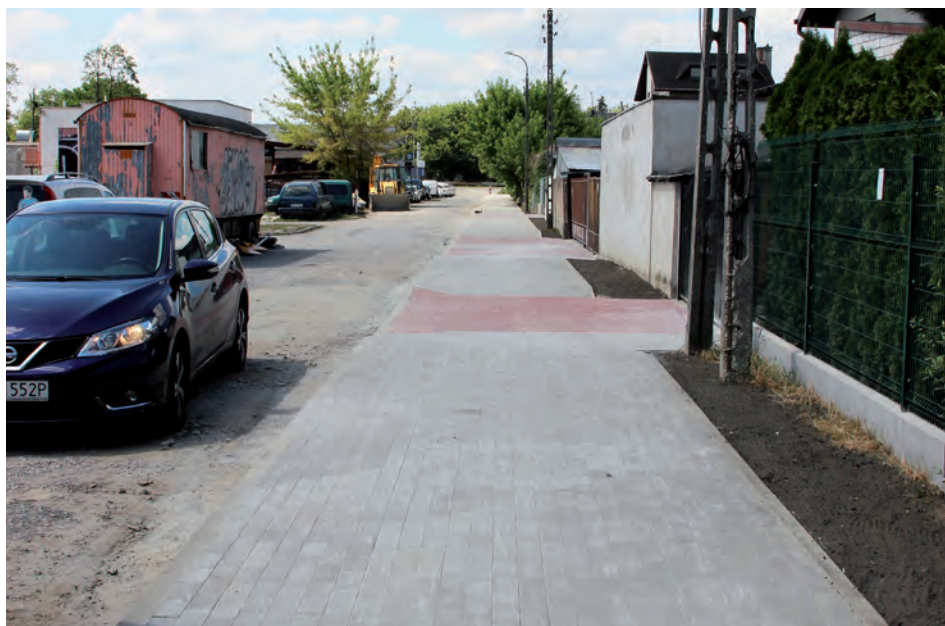
Ścieżka rowerowa na Nadrzecznej