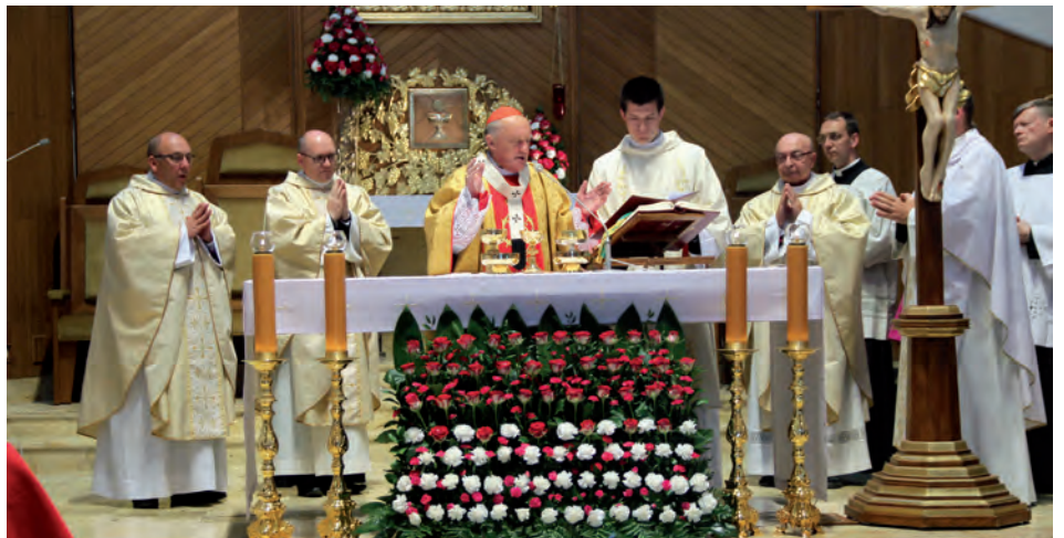
Msza św. Dziękczynna w kościele w Rybiu