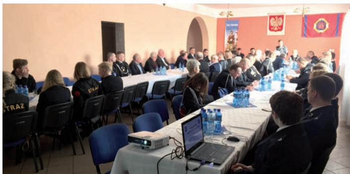
Walne w OSP Raszyn

W dniu 17 marca 2018r. odbyło się zebranie sprawozdawcze w OSP Raszyn.