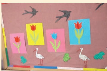
Prace dzieci ze Świetlicy SP w Ładach