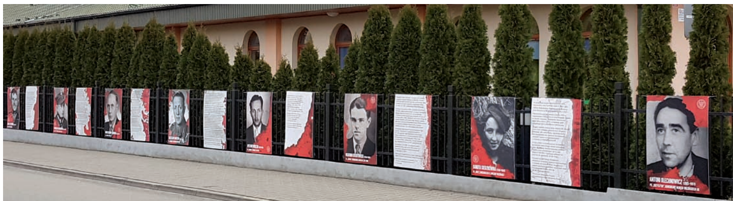
Wystawa NARODOWY DZIEŃ PAMIĘCI ŻOŁNIERZY WYKLĘTYCH w Świetlicy