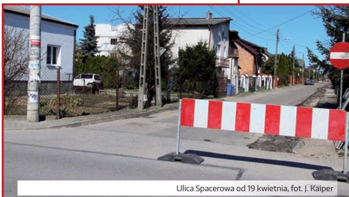
Ulica Spacerowa od 19 kwietnia

W Alei Krakowskiej od ul. Falenckiej do ul. Reja – projekt ścieżki pieszo – rowe- rowej za kwotę 65 928 zł, wykona Zakład Projektowania, Nadzoru i Usług Consul- tingowych INZDRÓG s.c. W. i K. Łuszyński z Grudziądz.