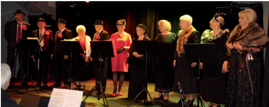
Barwy Jesieni