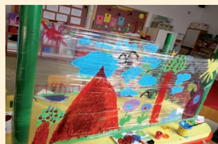
Prace dzieci ze Świetlicy SP w Ładach