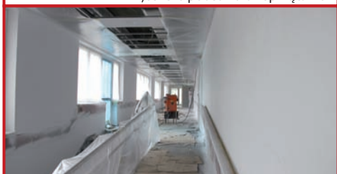
Korytarz na parterze