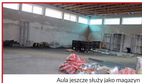
Aula jeszcze służy jako magazyn

Otynkowana i w wylewkach, prace pod sufitem zakończone, teraz schnie, nim będzie można układać wykładziny.