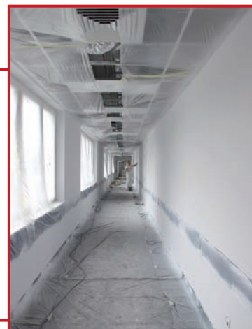
Ściany korytarza szykowane pod tapety

Ze wszystkich stron pokrywa ocieplenie częściowo w tynkach, okna i drzwi zewnętrzne zamontowane, wewnątrz wszystkie instalacje pokrywają pomalowane tynki, na podłogach wykładziny przykryte na czas budowy grubą folią, sanitariaty w terakocie i glazurach, większość podsufitek na swoim miejscu.