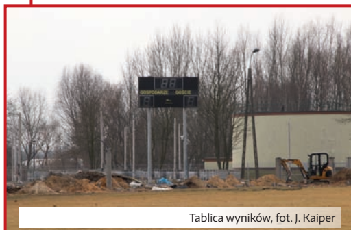
Tablica wyników

Skoro wszystkie media są już pod ziemią firma budująca halę wzięła się za porządkowanie terenu. Przed halą budowane są parkingi, prace postępują w miarę zwalnianego terenu. Z tyłu od strony elewacji południowej już jest parking dla autokarów, na nim maszty oświetleniowe. Od strony boiska tablica wyników głosi na razie „goście – gospodarze 0:0”. Cały obiekt jest z zewnątrz otynkowany, rozpoczęto montaż szklanych płyt elewacji, rozpoczynając od ściany z wejściem. Gdy ten numer dotrze do Państwa rąk prawdopodobnie cały front będzie nią pokryty. Elewacja zachodnia – wzdłuż boiska czeka na płyty. Wzdłuż niej wystają fundamenty pod piłkochwyty i dolna część masztów oświetleniowych.