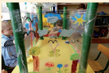
Prace dzieci ze Świetlicy SP w Ładach