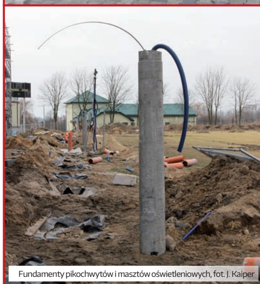
Fundamenty piłkochwytów i masztów oświetleniowych