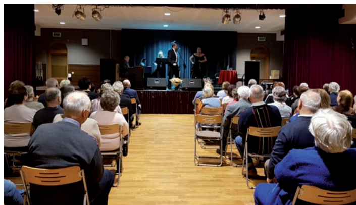
Koncert dla Pań