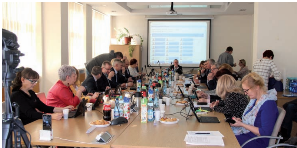
L Sesja rady Gminy Raszyn

Po chwili powrócono do obrad. Z początku Rada przyjęła protokół z XLIX Sesji, następnie uchwałą wyraziła zgodę na działania Wójta Gminy zmierzające do przekazania środków finansowych dla Komendanta Stołecznego Policji celem poprawy warunków pracy raszynskich policjantów w związku z budową nowego komisariatu. Kolejno uchwalono sprzedaż nieruchomości położonej we wsi Wypędy, następnie sprzedaż bezprzetargową maleńkiej działki w obrębie Raszyn