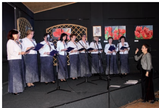
Koncert Pasyjny – Seniorki i E. Ciechomska