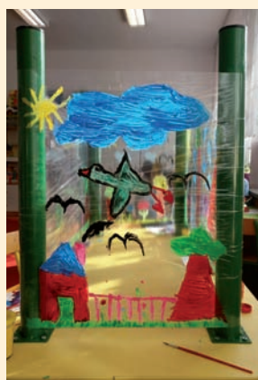
Prace dzieci ze Świetlicy SP w Ładach