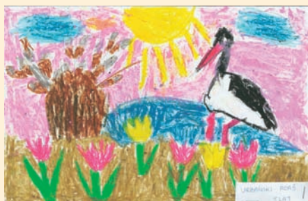
Adaś Urbański 5 lat