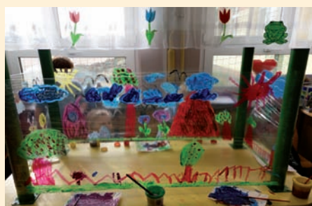
Prace dzieci ze Świetlicy SP w Ładach