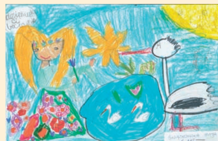
Maja Świątkowska 6 lat