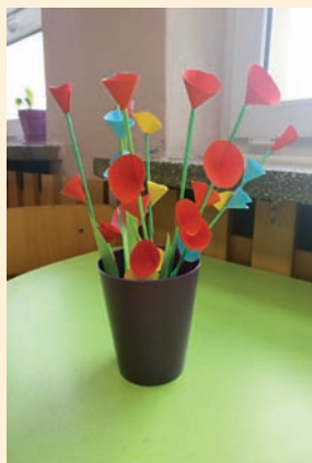
Prace dzieci ze Świetlicy SP w Ładach