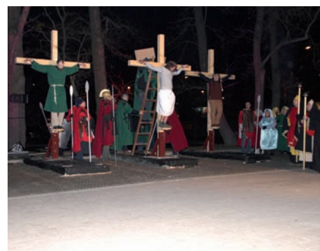
Ukrzyżowanie © J. Kaiper