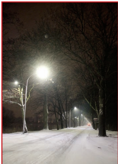
Aleja Hrabaska w marcowej, ale zimowej szacie