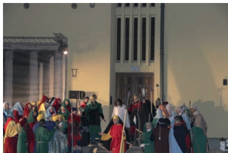
Jezus pojmany