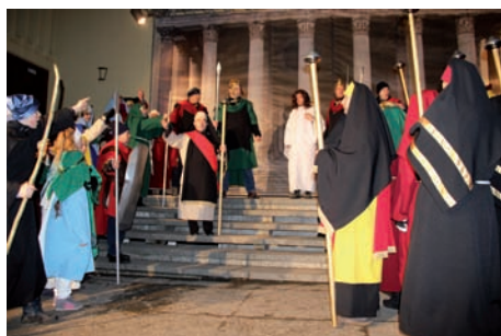
Od Anasza do Kajfasza