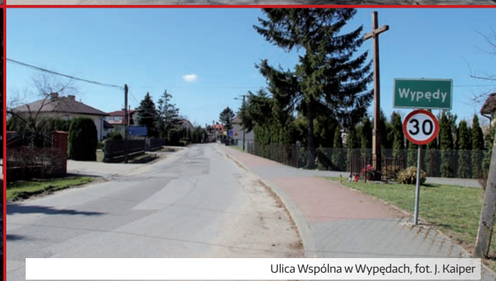
Ulica Wspólna w Wypędach