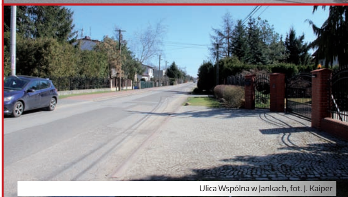
Ulica Wspólna w Jankach, fot. J. Kaiper