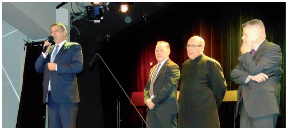
Życzenia dla Pań

Radna Gminy Raszyn, solistka zespołu „Seniorki”