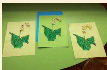
Prace dzieci ze Świetlicy SP w Ładach