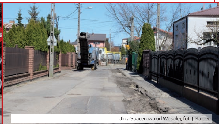
Ulica Spacerowa od Wesolej, fot. J. Kaiper