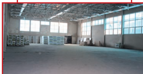
Wylewka w hali sportowej

Na zewnątrz budowy – wokół przedszkola i szkoły porządkowany jest teren, budowane wjazdy, zatoki dla samochodów, ścieżki dla pieszych, wznoszone są ogrodzenia. Boisko szkolne częściowo ukształtowane, czeka na ułożenie bieżni i sztucznej trawy.