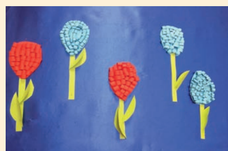
Prace dzieci ze Świetlicy SP w Ładach