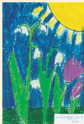
Julia Kłopotowska 7 lat