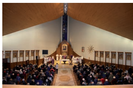
Uroczysta msza

W piątek poprzedzający Wielki Tydzień mieszkańcy gminy Raszyn wzięli udział w Drodze Krzyżowej, która odbyła się na trasie pomiędzy kościołami parafialnymi w Rybiu i Raszynie. W czasie uroczystej Mszy Świętej w kościele pw. Św. Bartłomieja Apostoła na Rybiu, która poprzedziła Drogę Krzyżową, ksiądz proboszcz