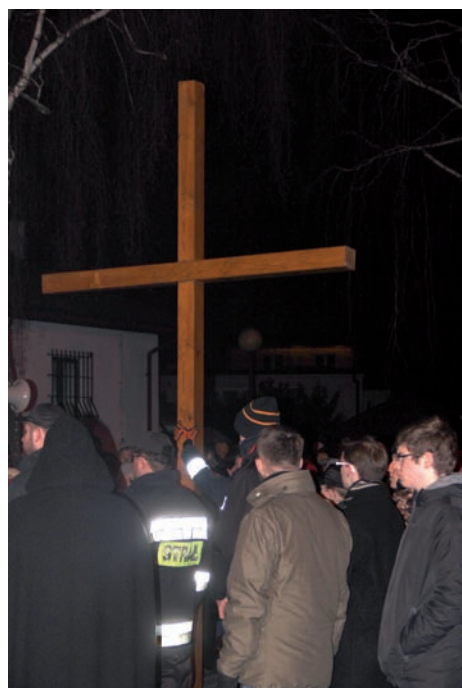
Droga Krzyżowa