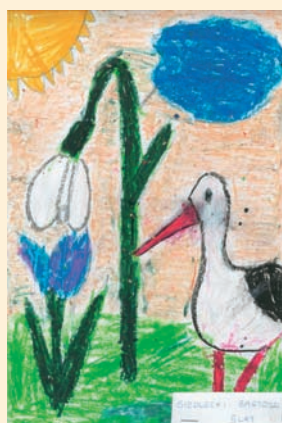
Bartosz Siedlecki 5 lat