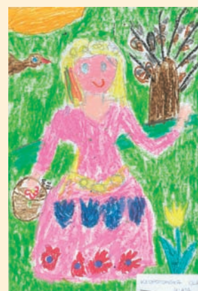
Ola Kłopotowska 4 lata