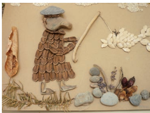
Tymoteusz Płatek III a

Iwona Szczęszek, nauczyciel bibliotekarz