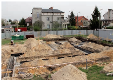
Budowa nowego komisariatu rozpoczęta

W tym roku to się udało. Warto wspomnieć, że pomimo sporego obciążenia kosztami innych wielkich inwestycji gmina Raszyn przeznaczyła 1,5 mln na wsparcie budowy komisariatu, które obok pieniędzy wpłacanych na dodatkowe etaty biurowe i zakup samochodów stanowią istotny wkład samorządu Gminy Raszyn w utrzymanie bezpieczeństwa na swoim terenie. Gdy tylko rozpoczęły się pierwsze prace na placu budowy pojawiła