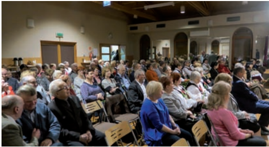
Liczna publiczność