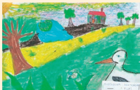
Wiktoria Siedlecka 7 lat