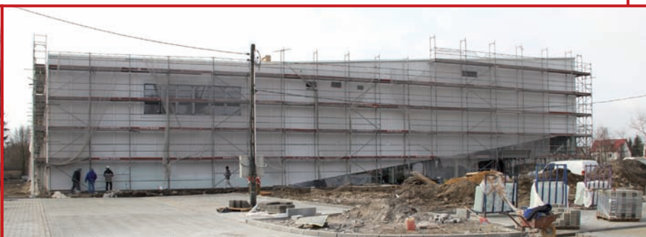
Elewacja północna