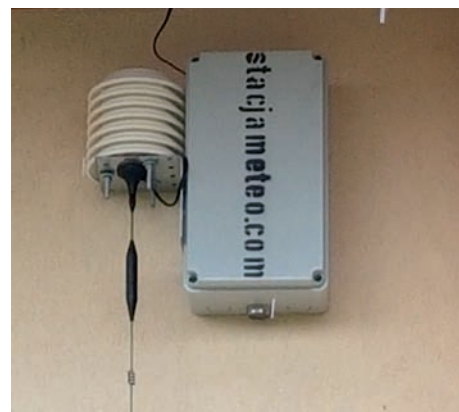
Czujnik jakości powietrza