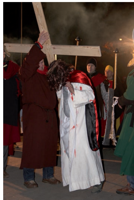
Szymon z Cyreny © J. Kaiper

przygotowywała od dwóch miesięcy występ. My, widzowie weszliśmy w świat na poły realny; bariery grodziły przestrzeń, na której po przeciwnej od nas stronie odbywało się misterium sprzed dwóch tysięcy lat. Tu współczesność, a tam przeszłość. Jedno splecione z drugim. Przedstawienie zaczęło się od sceny w Ogrodzie Oliwnym, a skończyło na Ukrzyżowaniu i zaznaczonym tylko Zmartwychwstaniu. Dźwięk,