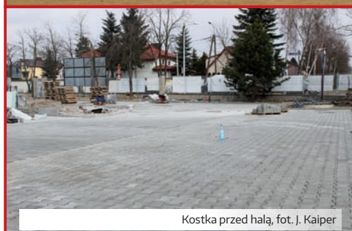
Kostka przed halą