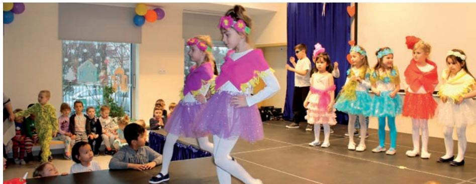
Taniec dla Mam