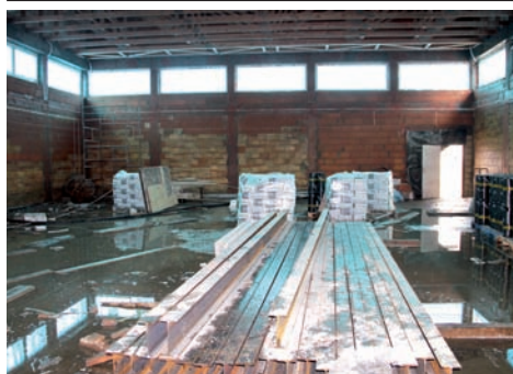
Aula wewnątrz