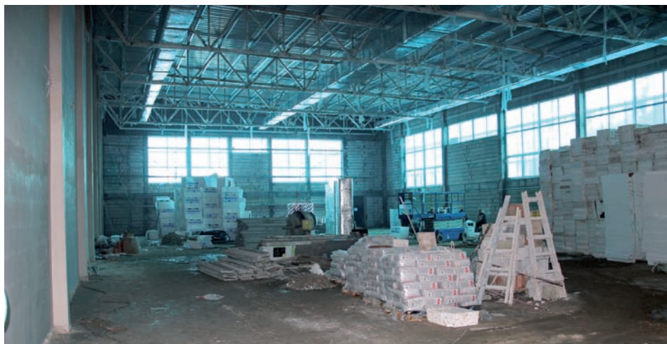
Hala sportowa © J. Kaiper

– Aula widowiskowa jest przykryta dachem i w znacznej części ocieplona. Okna są już na swoim miejscu. Prace koncentrują się teraz na uszczelnieniu dachu.