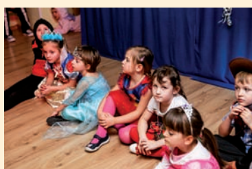
Odpuśczone po szalonej zabawie

„Jest karnawał, w karnawale wszyscy urządzają bale. To tradycja bardzo stara – strojów pięknych, co niemiara! Dziś na moje rozkazanie niech się miły nastrój stanie. Niech w zabawie, no i w tańcu spłotą się ręce przebierańców.”