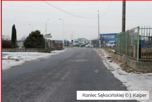
Koniec Sękocińskiej