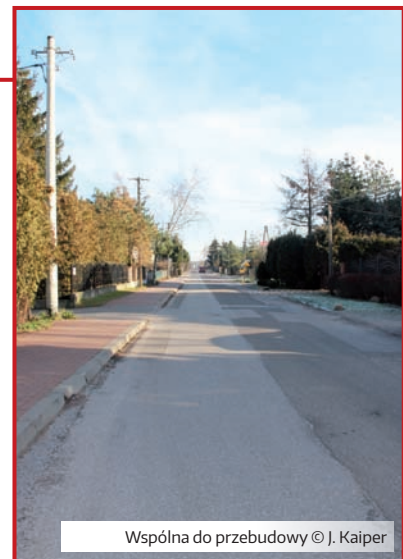
Wspólna do przebudowy

Za 3 848 841 zł ostatecznie przebudowana ulica Wspólna od skrzyżowania z ulicą Mszczonowską do połączenia z ulicą Kwietniową. Otrzymaliśmy na to dofinansowanie od Wojewody Mazowieckiego Zdzisława Sipiery w wysokości 1 924 420 zł w ramach programu: Rozwój gminnej i powiatowej infrastruktury drogowej na lata 2016 – 2019 . Jest to kolejna ulica, po Szkolnej, dofinansowana w ramach tego samego programu. Tak napisał o tym WPR w dniu 3.01.2018 w swoim wydaniu internetowym: „ Dofinansowanie na drogę otrzyma tylko Raszyn ” i tak rzeczywiście jest. Spośród podwarszawskich gmin, a wiele o to aplikowało, dofinansowanie na przebudowę drogi dostał tylko Raszyn. Uzyskanie tych pieniędzy wystawia wszystkim pracownikom Urzędu Gminy Raszyn odpowiedzialnym za przygotowanie projektu do konkursu najwyższą ocenę z fachowości.