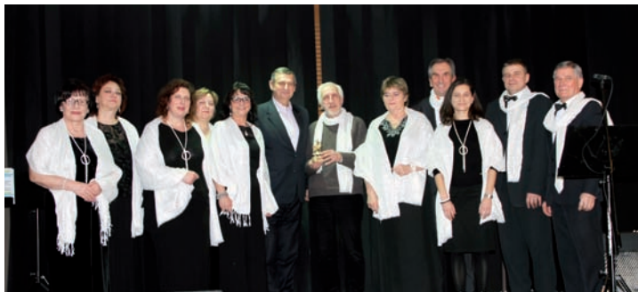
Fal-Canto z instruktorem F. Babińskim