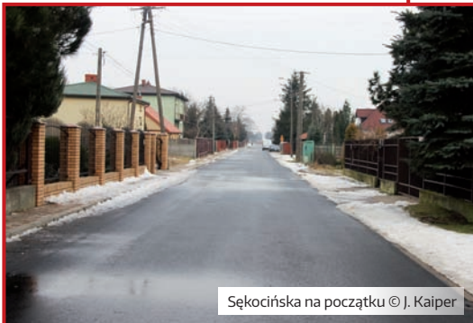
Sękocińska na początku

Ulica Piaskowa na odcinku od 19-go Kwietnia do ulicy Wesołej jest już od jakiegoś czasu przejezdna. Do sfinalizowania budowy całej ulicy Piaskowej został fragment pomiędzy ulicą Wesołą a ulicą Na Skraju. Na tym odcinku w trakcie zeszłorocznych prac pojawił się problem wynikający ze zbyt płytko wkopanej rury rozpraszającej gaz. Po przebudowaniu go przez gazownię, ekipy budujące ulicę podjęły pracę. Obecnie, po zamontowaniu instalacji, na jezdnię kładziona jest warstwa tłucznia. Gdy tylko pogoda pozwoli ostatni odcinek Piaskowej zyska nową nawierzchnię z kostki betonowej. Trzeba jeszcze trochę cierpliwości.