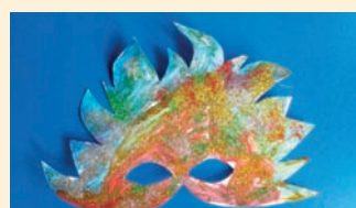
Przedszkole pod Topolą Kamil Zawiska, 6 lat