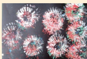
Noworoczne fajerwerki – Blanka Markwat, Przedszkole Nr 3 Wyspa Skarbów