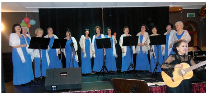
Seniorki i E. Ciechomska