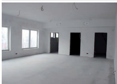
Przedszkole stan budowy