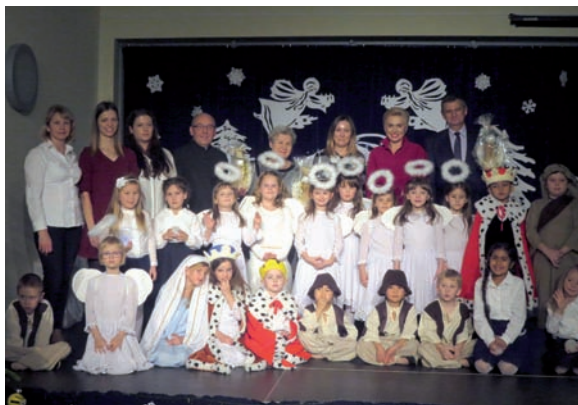
Po występie w towarzystwie gości

„Grudniowa piękna noc z kolędą przyszła do nas. Grudniowa piękna noc przez ludzi wymarzona”