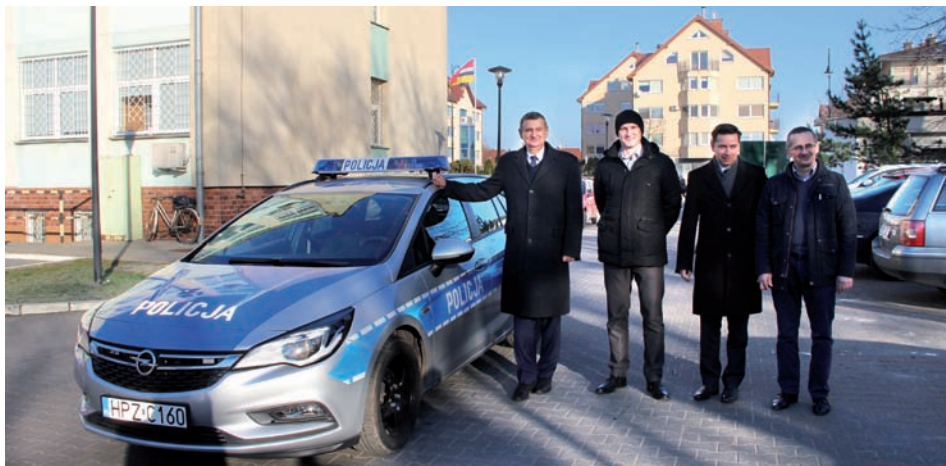
Radiowozы dla policji