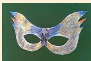
Maska karnawałowa – Mateusz Polinceusz, Przedszkole Nr 3 Wyspa Skarbów