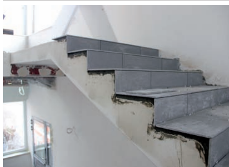
Przedszkole schody w terakocie