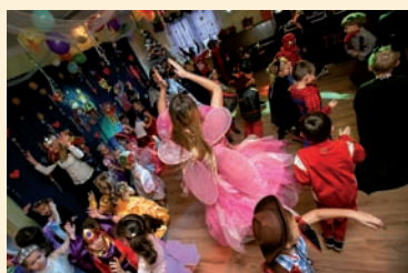
Taniec to nasz żywioł