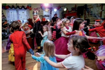
Uśmiechy nie schodzą z naszych buzi