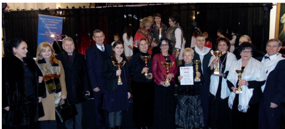
Przedstawiciele Gminy Raszyn

Tyle nagród przywieźli z Pruszkowa raszyńscy artyści