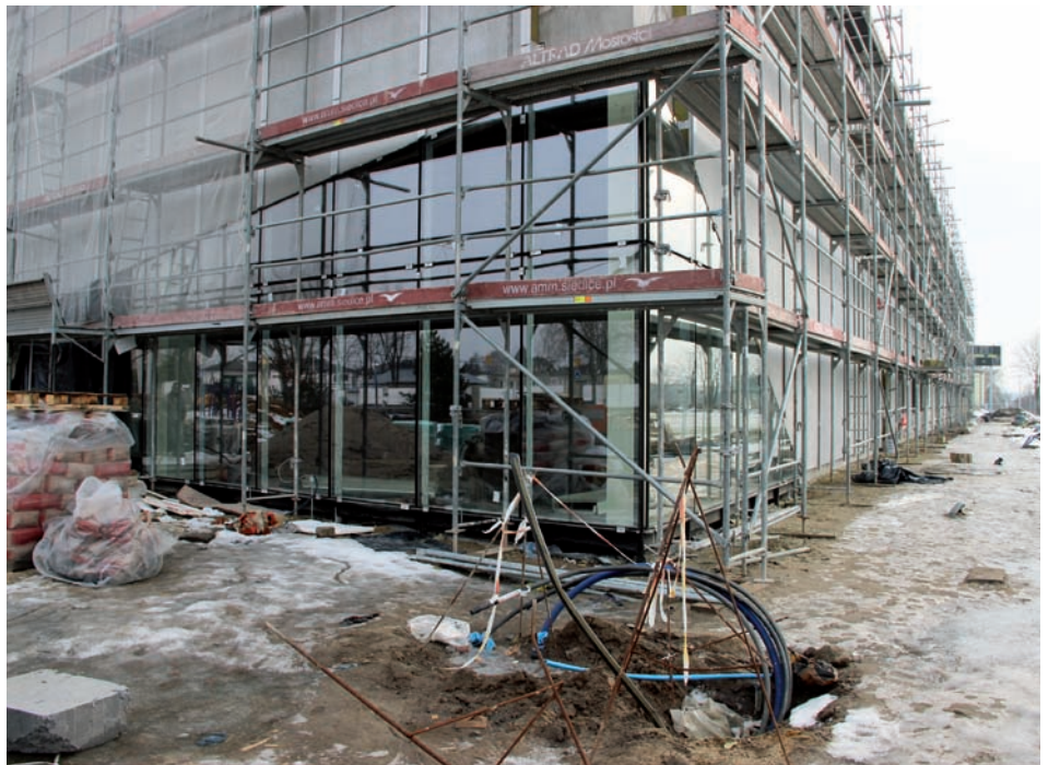
Oszklone wejście z zewnątrz