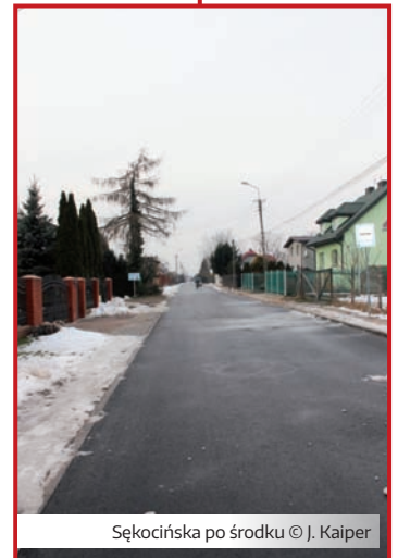
Sękocińska po środku

Powiatowa ulica Sękocińska w Sękocinie Starym została wybudowana we współpracy Gminy Raszyn i powiatu pruszkowskiego. Gmina, która sfinansowała w zeszłym roku instalacje podziemne: kanalizację sanitarną i deszczową, wykonała swoje zadanie fachowo i w terminie. Powiat pruszkowski, który miał odbudować jezdnię i chodniki napotkał na trudności przy wyborze wykonawcy. Okazało się, że wzrost cen rynkowych spowodował, że wycena inwestycji okazała się za niska i przetarg trzeba było powtarzać. Istniała uzasadniona obawa niedotrzymania terminów zakończenia budowy. Taka sytuacja skazywałaby mieszkańców Sękocina na trudności komunikacyjne w zimie i na przedwiośniu. Jednak udało się porozumieć z wykonawcą, a łagodna jak dotąd aura pozwoliła na położenie asfaltu. Gdy chodniki zostaną dokończone wiosną, ulica Sękocińska będzie nie do poznania.