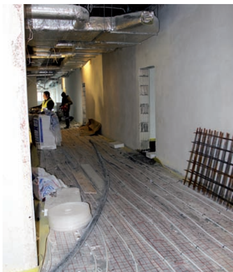
Szkola ogrzewanie podłogowe na wierzchu

i podwieszanie sufitów na piętrze. Wkrótce rozpocznie się montowanie wewnętrznych drzwi, malowanie ścian i układanie wykładzin podłogowych. Zakończy budowę wyposażanie w urządzenia, meble i zabawki. Widząc zaawansowanie prac można być pewnym, że termin otwarcia zostanie dotrzymany.