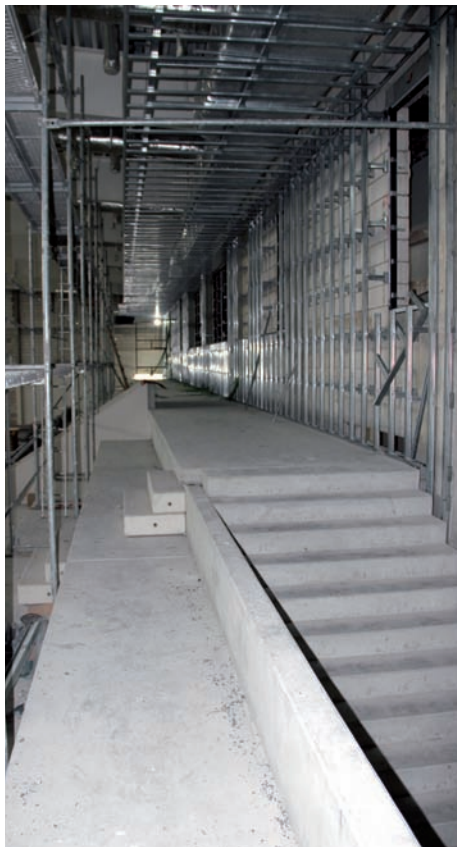
Stelaże pod panele nad trybunami