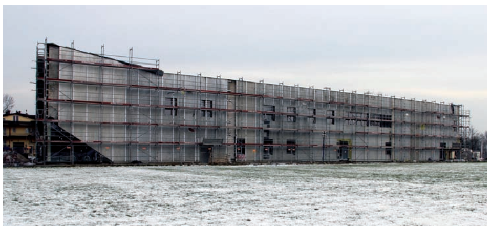
Hala w całej okazałości