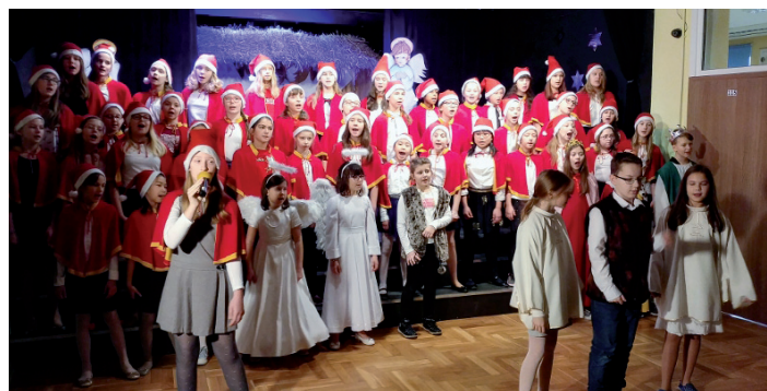
Koncert kolęd