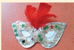
Maska karnawałowa – Sandra Lubińska, Przedszkole Nr 3 Wyspa Skarbów