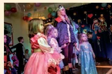
Królowa z rycerzem