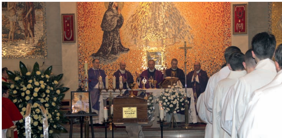
Dekanalna msza święta w kościele parafialnym Św. Faustyny