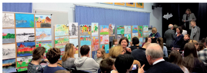
Finał konkursu Nadwiślańskie Miasta

Jak co roku, uczniowie naszej szkoły (50 uczestników) wzięli udział w konkursie rysunkowo-malarskim, organizowanym przez PTTK Oddział Ochota im. W. Żuławskiego w Warszawie. Hasłem tegorocznego konkursu „NADWIŚLAŃSKIE MIASTA” włączyliśmy się do ogólnopolskich obchodów Roku Rzeki Wisły i realizacji hasła programowego PTTK na rok 2017 „Wisła łączy”, a zachęceni do udziału w imprezie, zapoznawaliśmy się z historią, zabytkami oraz ciekawostkami dotyczącymi miast leżących nad królową polskich rzek. Uroczyste rozdanie nagród książkowych połączone z prezentacją nagrodzonych prac odbyło się tradycyjnie w Młodzieżowym Domu Kultury „Ochota”. Oto laureaci konkursu, którym serdecznie gratulujemy!