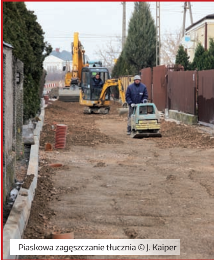
Piaskowa zagęszczanie tłucznia