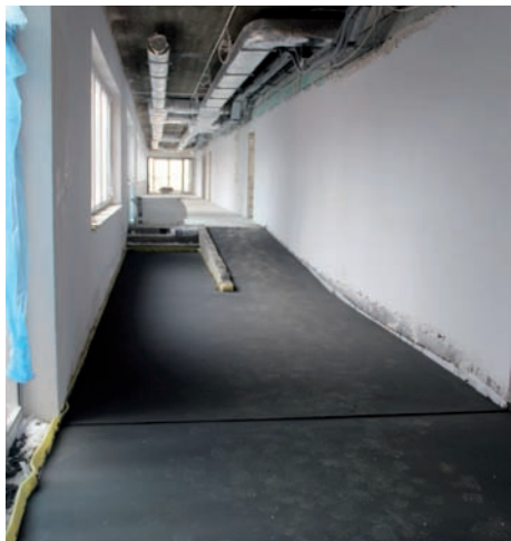
Łącznik pomiędzy przedszkolem i szkołą

– W Oddziale Przedszkolnym przy Szkole Podstawowej w Ładach trwają ostatnie prace. Większość instalacji jest już na swoim miejscu. Parapety na oknach też są. Teraz przyszła kolej na terakotę na klatkach schodowych