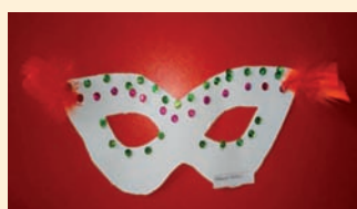
Przedszkole pod Topolą Oleksii Oliinyk, 4 lata