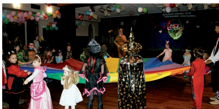
Zabawa z chustą zawsze jest ciekawa