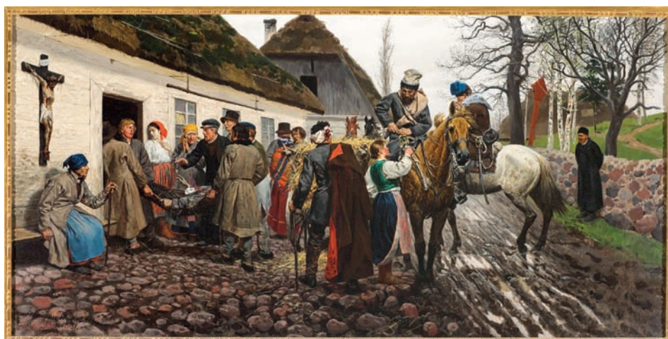
Stanisław Witkiewicz – Ranny powstaniec. Muzeum Narodowe w Warszawie

prawnuczka powstańców po mieczu i po kądzieli