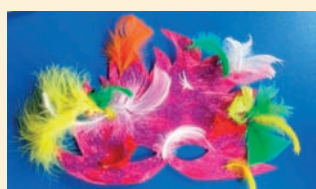
Przedszkole pod Topolą Oliwia Michalska, 6 lat