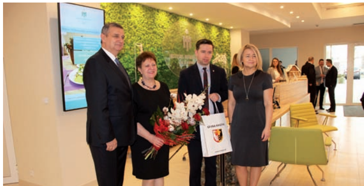
W trakcie uroczystości otwarcia