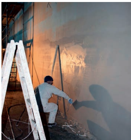
Tynkowanie hali