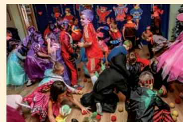
Łapiemy kolorowe kuleczki