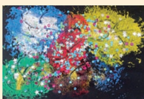
Noworoczne fajerwerki, Witold Stoklosa, Przedszkole Nr 3 Wyspa Skarbów