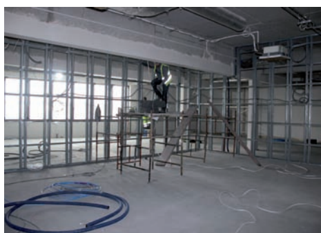
Sala fitness