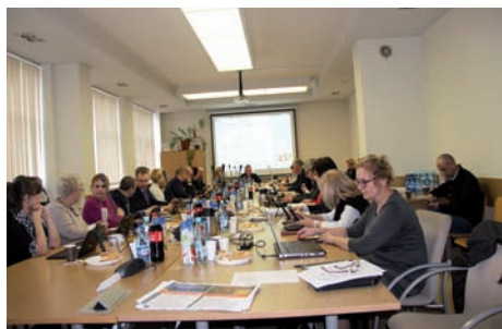
XLVIII Sesja Rady Gminy Raszyn

Pierwsza w tym roku, a w kadencji XLVIII Sesja Rady Gminy Raszyn trwała krótko i mimo że jej termin przypadł w czasie ferii szkolnych, zgromadziła na obradach 19 z 21 radnych i prawie wszystkich sołtysów.