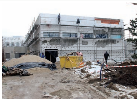
Aula z zewnątrz