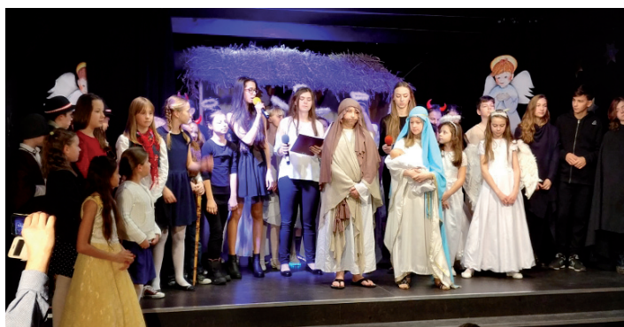
Jasełka klas starszych