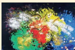
Noworoczne fajerwerki – Kuba Kowalski, Przedszkole Nr 3 Wyspa Skarbów