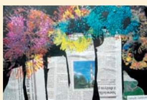
Przedszkole pod Topolą Jakub Jabłoński, 6lat