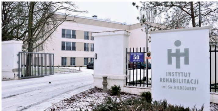
Instytut Rehabilitacji im. Św. Hildegardy